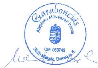
Mészáros Béla igazgató